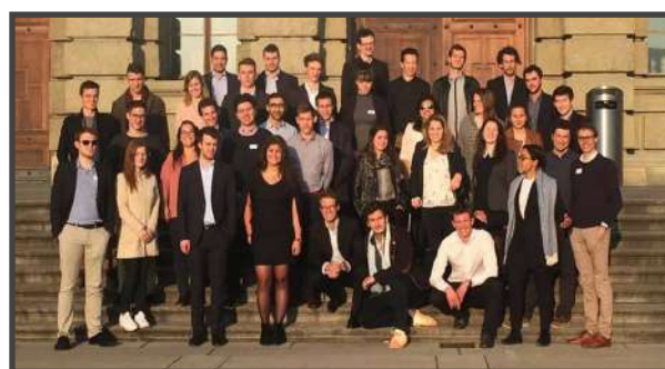
NATIONAL MEETING - ZURICH

JADE Switzerland regroupe onze Junior Entreprises suisses. Son rôle est de soutenir les Junior Entreprises, de promouvoir le mouvement en Suisse et de réunir les Junior Entreprises suisses afin d'encourager la collaboration et les partenariats.