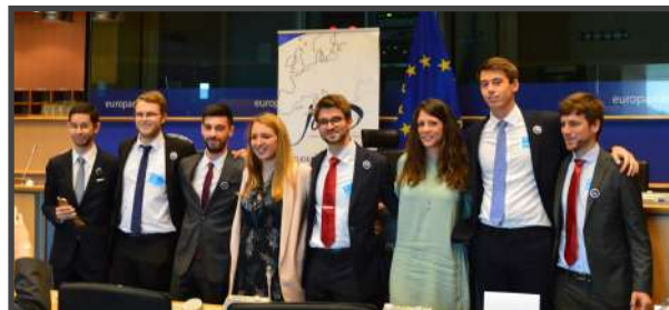
JADE - PARLEMENT EUROPEEN